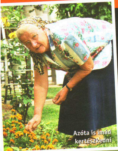
Azóta is imád kertészkedni