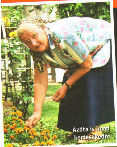
Azóta is imád kertészkedni